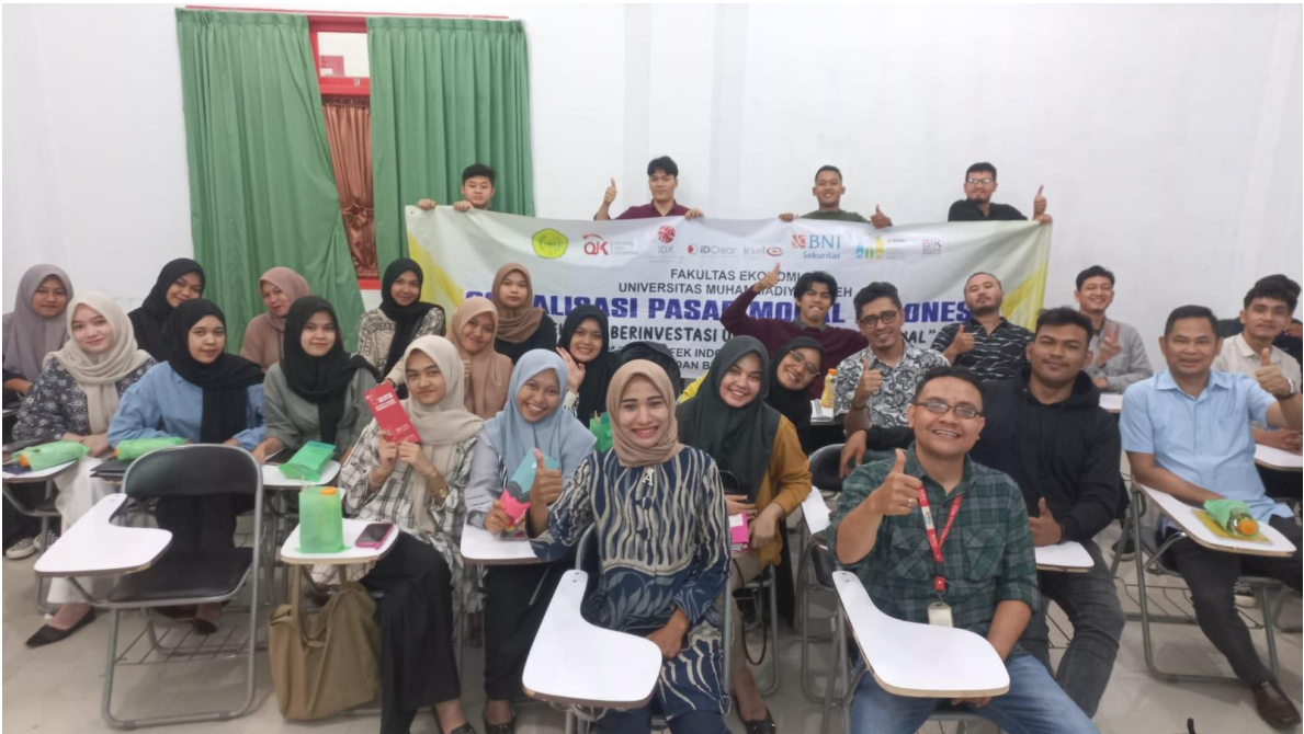
Gambar 2 : Foto Bersama setelah kegiatan