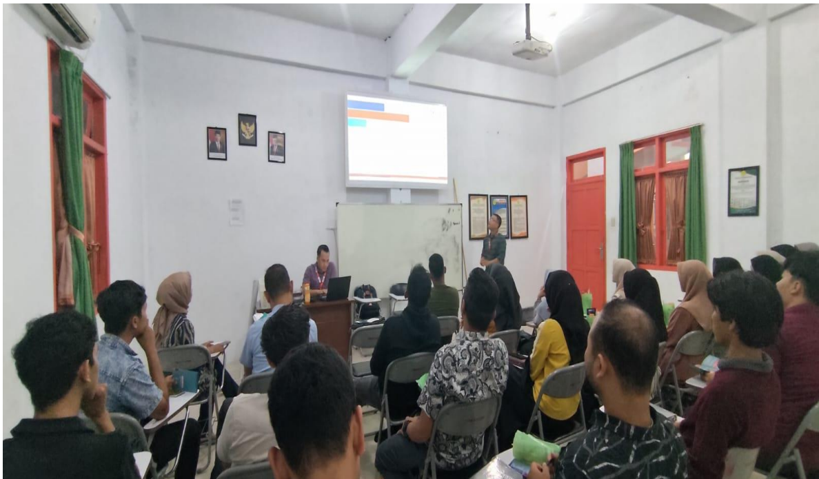
Gambar 1: Para Peserta sedang mengamati Presentasi

Peserta lebih menyukai media edukasi berbasis digital dibandingkan dengan metode konvensional seperti brosur atau seminar tatap muka. Hal ini terlihat dari tingkat partisipasi dan interaksi peserta selama kegiatan.